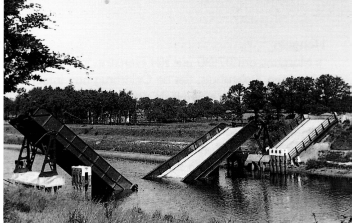
■ De opgeblazen Boekelosebrug

Het Twente-Rijnkanaal, gegraven in de eerste helft van de jaren '30 en de zijtak Wiene - Almelo in de tweede helft, was met spoor- en andere bruggen gereed in 1938. Juist de zijtak werd in 1940 als een belangrijke verdedigingslinie gezien door het Nederlandse Leger. Vandaar dat er op talrijke plaatsen aan de oostzijde van het kanaal bij de bruggen prikkeldraad- versperringen en mangaten waren aangebracht. Met de komst van de Duitsers zijn op 10 mei 1940 de spoorbrug bij Wiene samen met alle zeven bruggen (Tankinkbrug, Cottwickerbrug, Warmtinkbrug, Vredesbrug, Hoeselerbrug, Leemslagebrug, Wierdensebrug) opgeblazen. Dit gebeurde in het vak Zutphen - Enschede eveneens met de Markelosebrug, Diepenheimsebrug, Weldammerbrug, Hengelerbrug en Dorrebrug. De bruggen over het hoofdkanaal zijn in 1941 alle hersteld. Langs de zijtak zijn in 1942 de brug tussen Delden - Goor: Cottwickerbrug, de brug tussen Bornebroek - Enter: Vredesbrug en die tussen Almelo - IJpelo: Leemslagenbrug met de spoorbrug vernieuwd. In april 1945 zijn ze allemaal weer vernield. 26