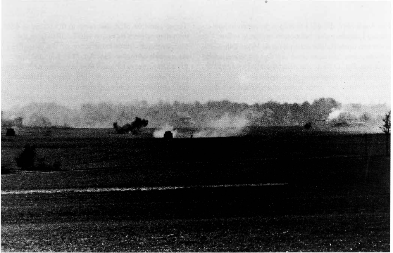
■ 4e peloton A-eskadron Sherwood Rangers Yeomanry in actie bij Barchem