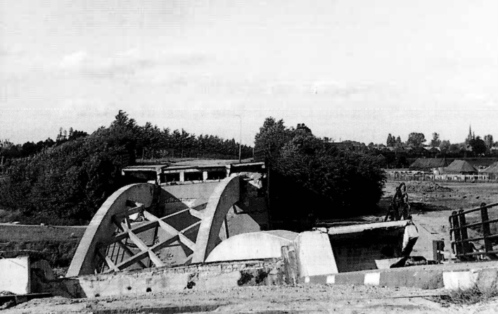
■ De opgeblazen Oelerbrug gezien vanuit Beckum

■ Blown up Oeler bridge looking into Hengelo