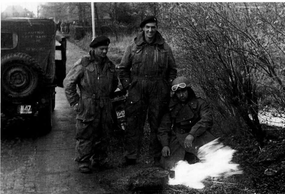
■ Voedselbereiding in de berm bij Beckum