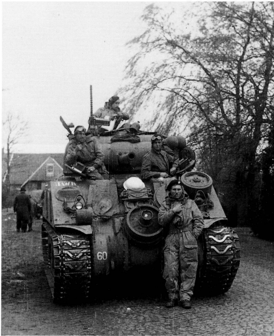
■ 1e Pantserbataljon Coldstream Guards in Beckum