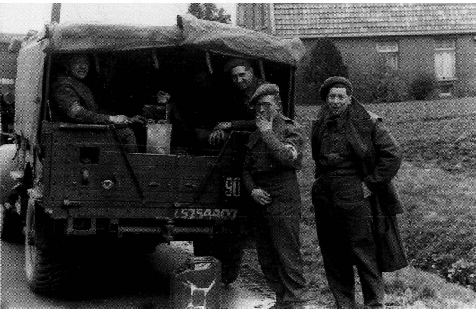
■ Geneeskundige eenheid, 128 Field Ambulance in Beckum, Schoolweg