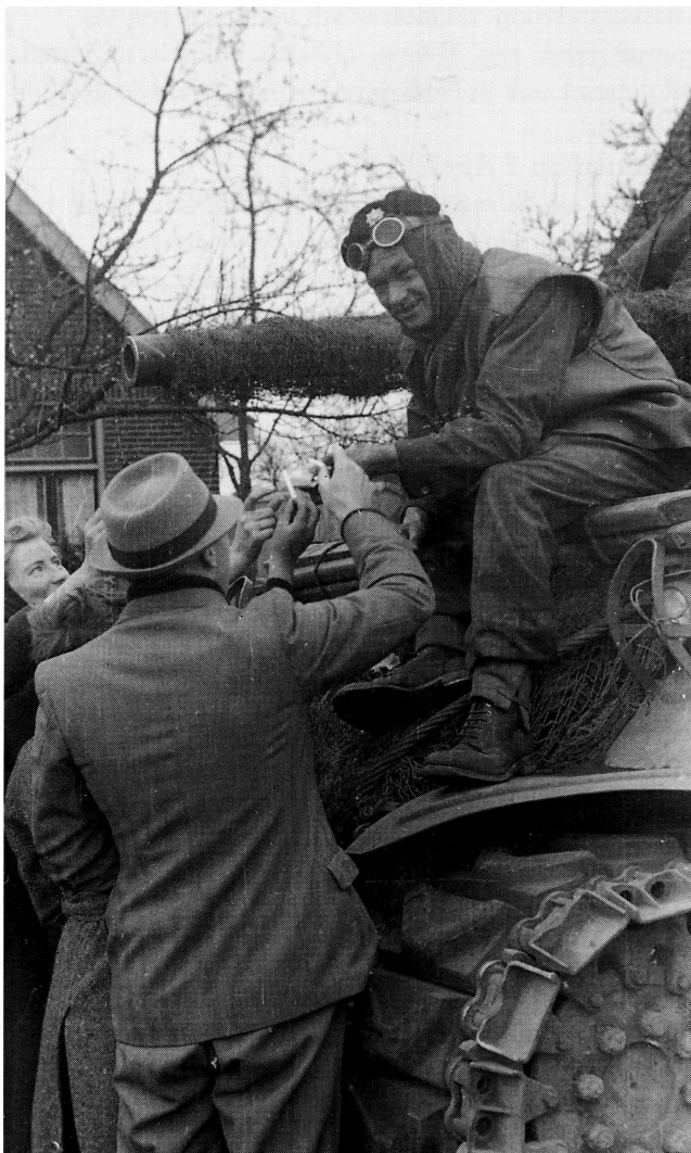
■ 1e Pantserbataljon Coldstream Guards deelt sigaretten uit in Beckum, Haaksbergerstraat 191

On the 1st of April at 08.00 hours the 5th Bat of the Coldstream Guards (infantry) of the Guards Armoured Division marches into Beckum after light resistance. The battalion comes from the direction of Neede - Rietmolen and is on its way to the Lonneker bridge at Enschede. The B-squadron of Maj. Priestly, 1st Arm. Coldstream Guards (tanks), accompanies this unit. 110 Germans are taken prisoner. 7 Tanks take up position at the crossroads in the direction of Boekelo, Sluitedijk.