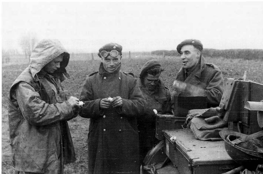
■ Eieren pellen in Beckum, Haaksbergerstraat 199