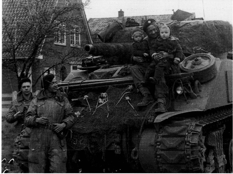
■ 1e Pantserbataljon Coldstream Guards in Beckum, Haaksbergerstraat 191a