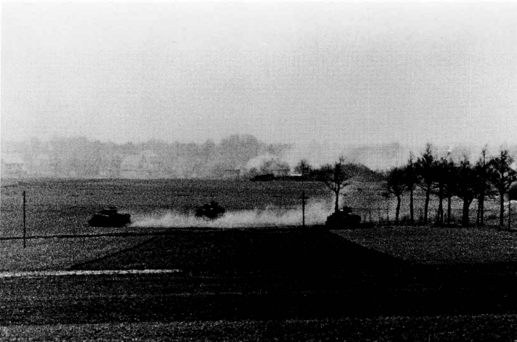
■ 4e peloton A-eskadron Sherwood Rangers Yeomanry in actie bij Barchem