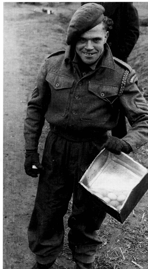
■ Gelukte paaseieren in Beckum