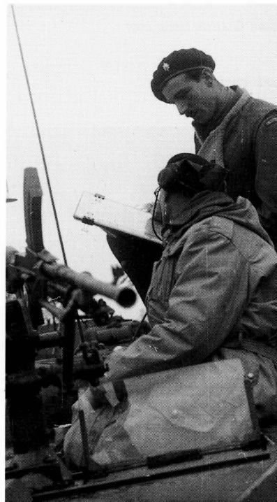
■ Commandant verkenningswagen (Humber) van de Coldstream Guards bezig met kaartstudie in Beckum