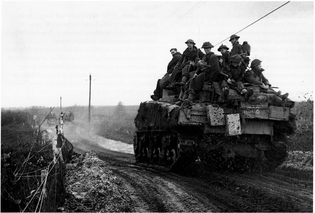
■ Shermans van de 13th/18th Hussars vervoeren mannen van de 43e Wessex Divisie