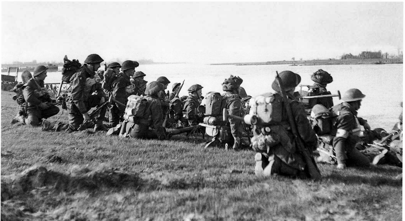
■ Mannen van het Dorset regiment slaan het gevecht aan de overzijde van de Rijn gade, terwijl zij wachten op hun beurt om over te steken

The break out from the area Nijmegen - Arnhem does not take a northerly, but an easterly course via the Maas and Roer crossing to the Rhine. Hence it was necessary to break through the Siegfried Line in the sector Nijmegen - Venlo to the cities of Emmerich and Wesel. After heavy fighting, for instance in the Reichswald, the set targets on the banks of the River Rhine are reached on 10 March.