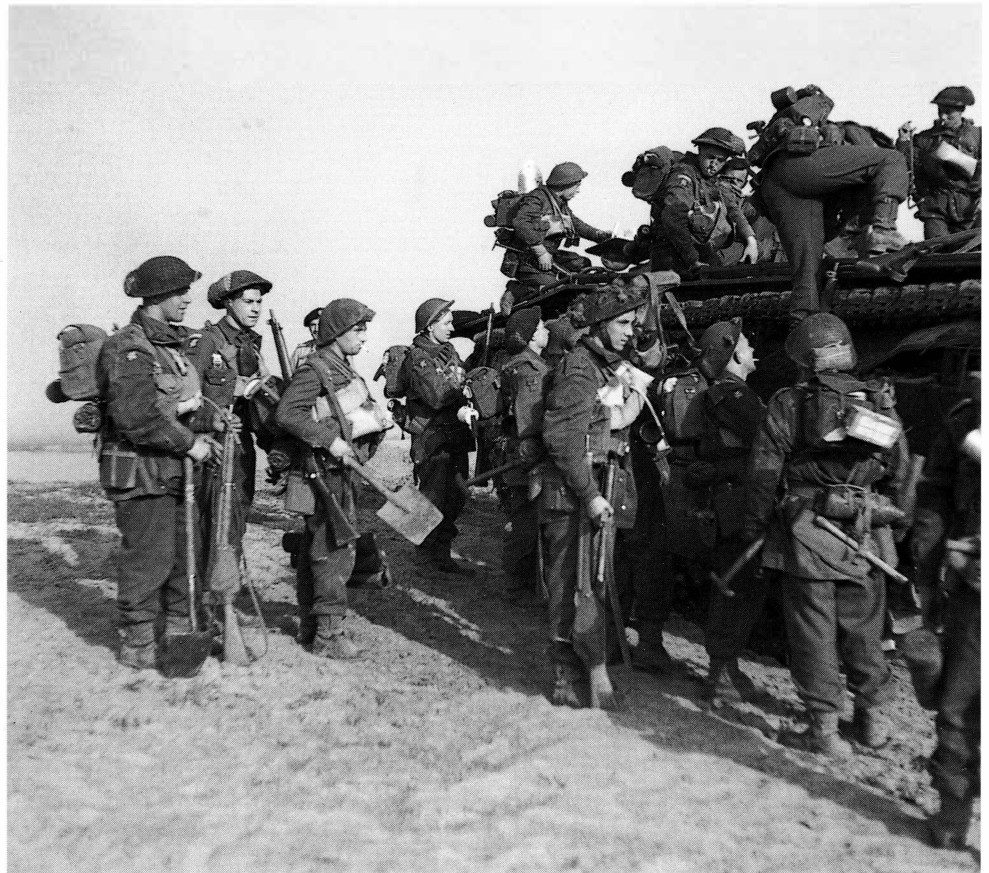
■ De Dorsets klimmen in de Buffalo's om er de Rijn mee over te steken

Two army corps had to cross the Rhine between Emmerich and Wesel to establish a bridgehead there as far as behind the Oude IJssel river. The 12th Corps get the Rees - Wesel zone and the 30th Corps Emmerich - Rees zone.